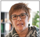
Regina Roemen Kontakt- und Beratungsstelle Willich-Wekeln

Fon: 0 21 62 / 81 67 56 -0 c.bergmann@phg-viersen.de